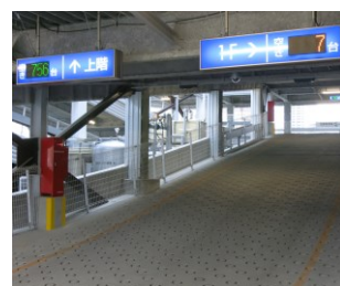
入口/分岐部での空き台数表示