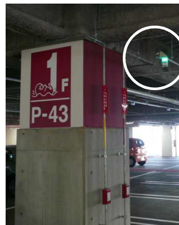
【写真上】空車時 【写真左】満車時