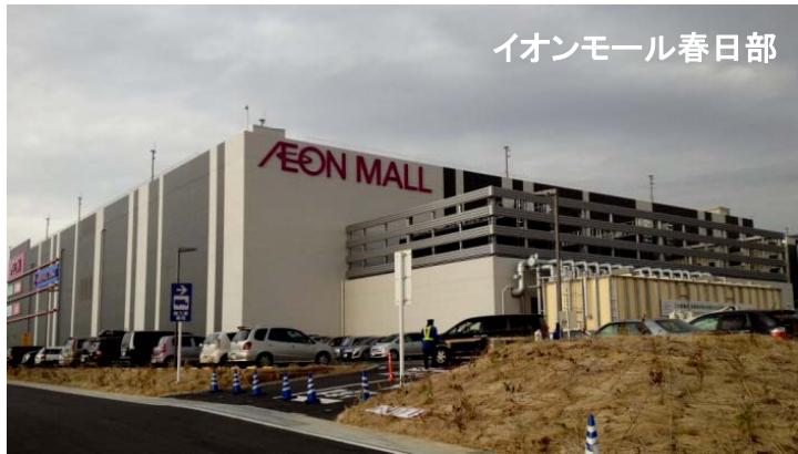
イオンモール春日部

身障者駐車枠全体をフェンス等で囲うことができる場合は、入口/出口のゲートだけでシステムが構成できます。広い通路を遮る場合、従来は長くて重いバーが必要でしたが、ウレタン製のミニバーで、より快適で安全なシステムが構築できます。