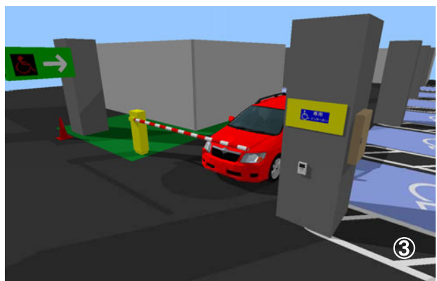
③ 出庫時は、ゲート内側のループコイルにより自動的にゲートが開きます。