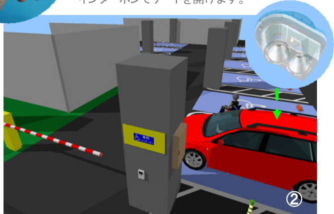
② 利用状況は、超音波センサー（EP-Ⅲ）により管理室で確認できます。

別フロアにある管理PC画面では、利用状況(どのリモコンで開けられ、何時から利用しているか)が一目でわかり、クリック操作でゲートを開けることができます。