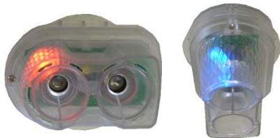
天井設置型 車両センサー (EP-Ⅲ)